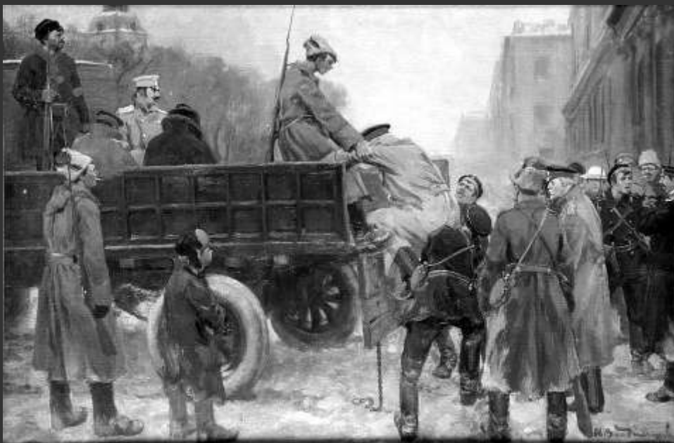
И.А. Владимиров. Арест царских генералов в феврале 1917 года.