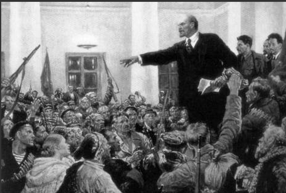
В.А.Серов. Ленин провозглашает советскую власть на 2-м съезде Советов.