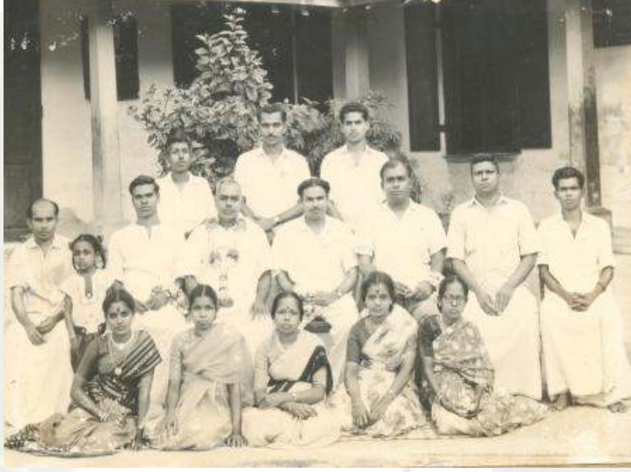
பணி ஓய்வு பெற்ற போது