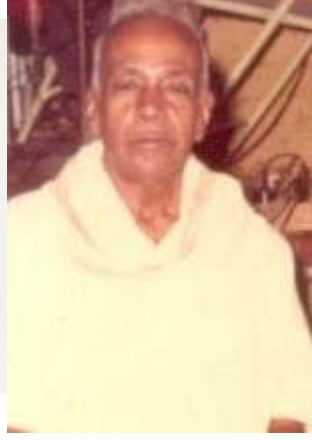
74 வது வயதில்