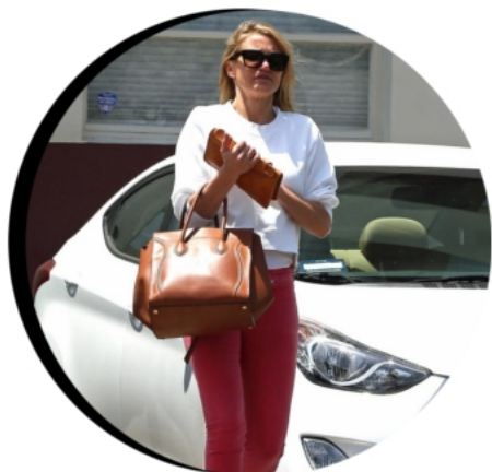
8 MAI 2014 LOS ANGELES

Suivez Cameron Diaz pendant toutes ses sorties, apparitions publiques ou télé, voyages promotionnels... Suivez la flèche rouge