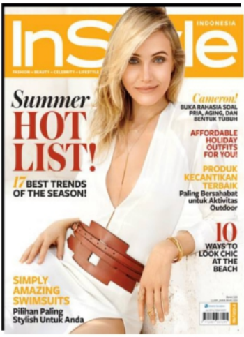
IN STYLE - INDONESIE JUILLET 2014