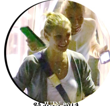
25 JUN 2014 CAMERON & GWYNETH SORTANT D'UN DÎNER AU GIORGIO BALDI RESTAURANT, L.A.