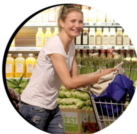
17 MAI 2014 CAMERON FAIT SES COURSES BEVERLY HILLS