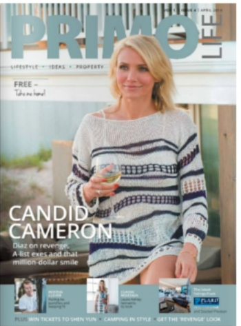
PRIMO LIFE - AUSTRALIE AVRIL 2014