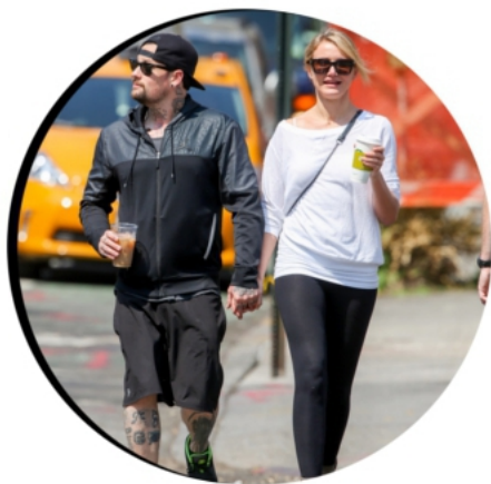
03 JUN 2014 CAMERON & BENJI MADDEN SORTENT PRENDRE UN CAFE À NEW YORK CITY