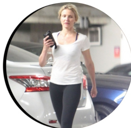
15 MAI 2014 CAMERON FAIT SA GYM LOS ANGELES