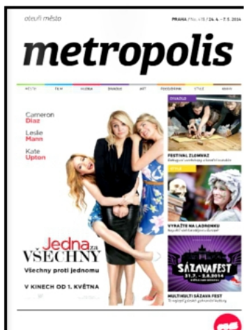
METROPOLIS - REP. TCHEQUE 24 AVRIL 2014