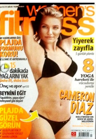
WOMEN'S FITNESS - TURQUIE JUILLET 2014