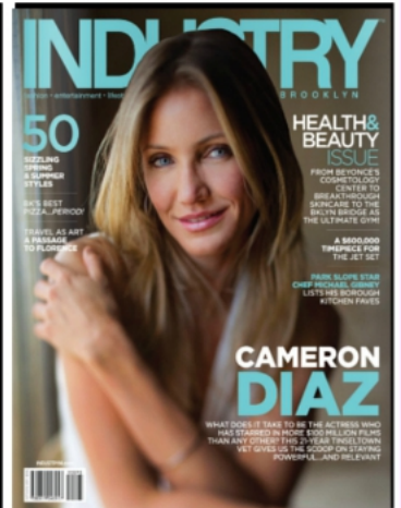
INDUSTRY - USA JUN 2014