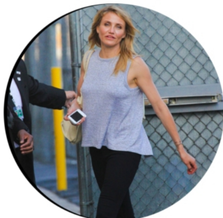
11 JUN 2014 CAMERON QUITTANT LES STUDIOS DU JIMMY KIMMEL SHOW, À LOS ANGELES