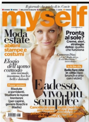
MYSELF - ITALIE JUN 2014