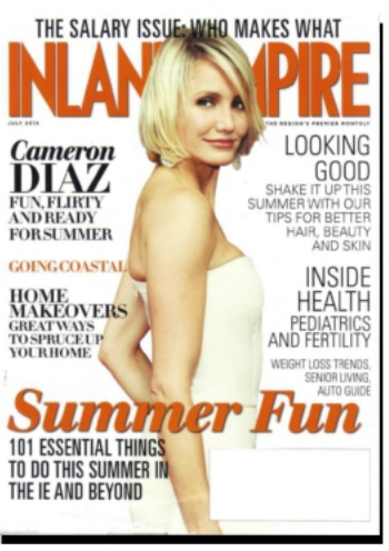
INLAND EMPIRE - USA JUILLET 2014