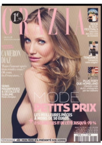
GRAZIA - FRANCE 20 JUN 2014