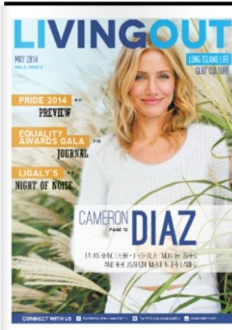
LIVING OUT - USA MAI 2014