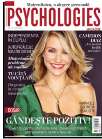
PSYCHOLOGIES - ROUMANIE MAI 2014