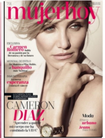
MUJER HOY - ESPAGNE 07 JUN 2014