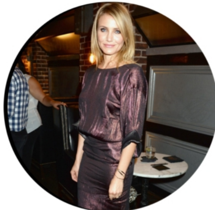
07 JUN 2014 2014 SPIKE GUY'S CHOICE AWARDS, CALIFORNIE