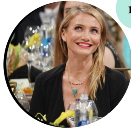
05 JUN 2014 2014 AFI LIFE ACHIEVEMENT AWARDS, HOLLYWOOD