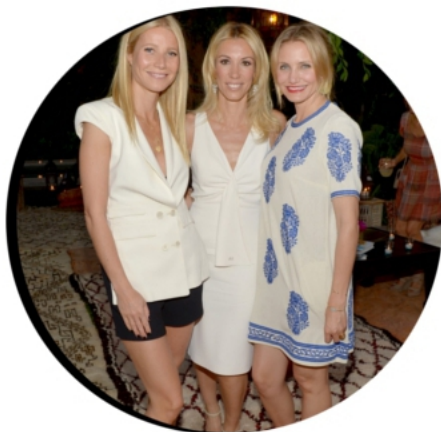
15 MAI 2014 THE BODY DOESN'T LIE LAUCH PARTY - LOS ANGELES