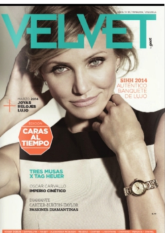
VELVET - VENEZUELA PRINTEMPS 2014