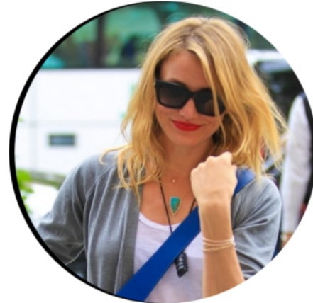
17 JUN 2014 CAMERON ARRIVANT À L'HÔTEL MANDARIN DE BARCELONE POUR LA PROMO DE "SEX TAPE"