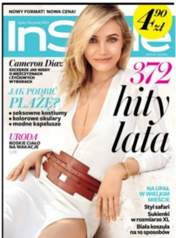
IN STYLE - POLOGNE JUILLET 2014