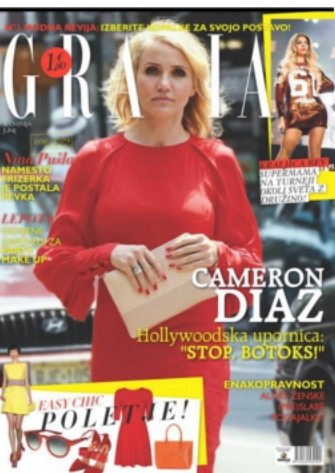
GRAZIA - SLOVENIE JUN 2014