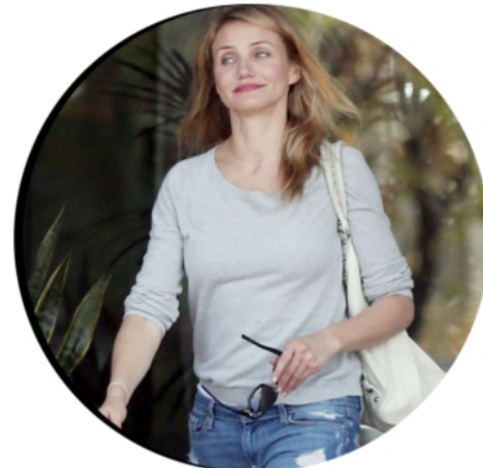
10 JUN 2014 CAMERON SORTANT D'UN BUILDING, À LOS ANGELES