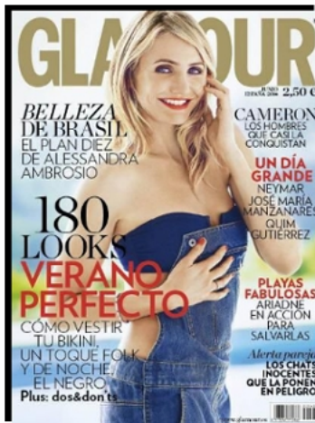
GLAMOUR - ESPAGNE JUN 2014