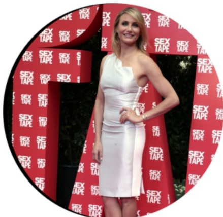
18 JUN 2014 PREMIERE DE "SEX TAPE" À BARCELONE