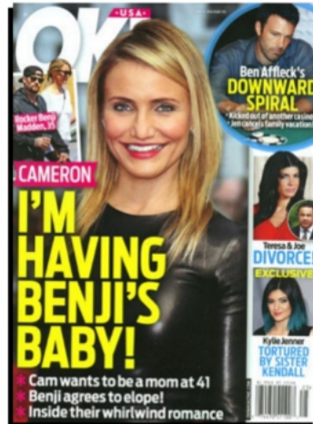
OK! - USA 23 JUN 2014