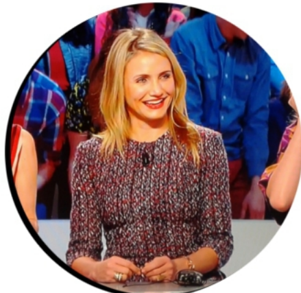
06 JUN 2014 THE OTHER WOMAN PROMO LE GRAND JOURNAL, FRANCE