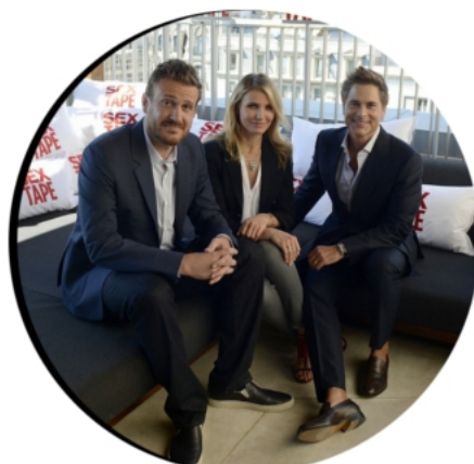
19 JUN 2014 PHOTOCALL DE "SEX TAPE" À BARCELONE