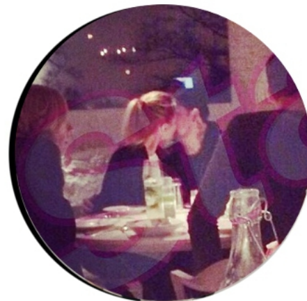
01 JUN 2104 CAMERON & BENJI MADDEN À ABC KITCHEN, À MANHATTAN