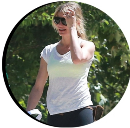
13 MAI 2014 CAMERON FAIT SA GYM LOS ANGELES