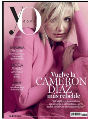
YO DONNA - ESPAGNE 07 JUN 2014