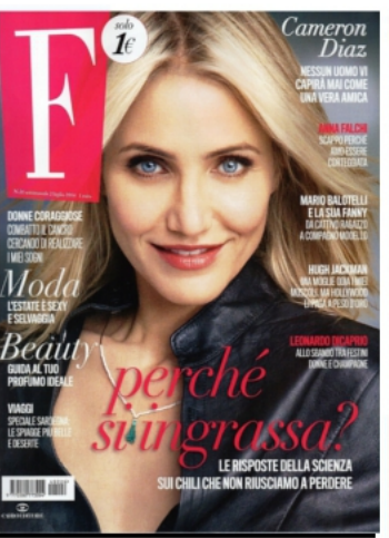
F - ITALIE 2 JUILLET 2014