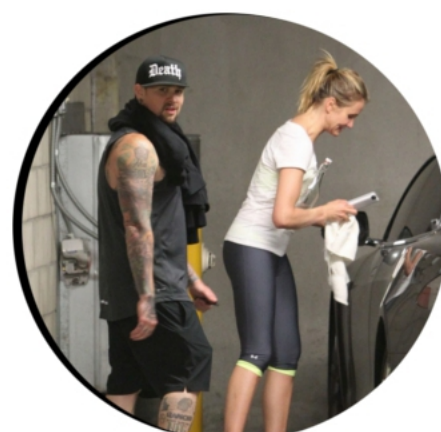
17 MAI 2014 CAMERON & BENJI MADDEN FONT LE PLEIN À BEVERLY HILLS