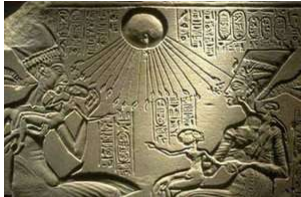
Akhenaten, Firaun pertama menyembah satu Tuhan

Atas dasar pemahaman inilah, ada orang yang menyimpulkan pada masa ribuan tahun yang silam, umat manusia bukan saja membangun peradaban di bumi tetapi juga telah merintis koloni-koloni di planet-planet lain, yang memiliki sumber-sumber kehidupan yang sesuai bagi umat manusia.