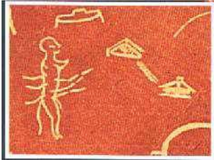
Peche Merle Cave, France, paintings, 17.000-15.000 SM

Pada lukisan di atas, yang berasal dari masa ribuan tahun yang silam, dapat kita lihat bahawa umat manusia telah mengenal teknologi antariksa. Nampaknya, umat manusia mengalami kemunduran teknologi disebabkan oleh kehancuran peradaban akibat dari peperangan dan bencana alam.