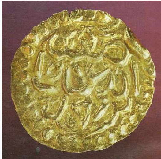
Dinar Emas Pasai Bertulisan Kunlu

Jika telah wujud bahasa kunlu, maka bahasa kunlu tu bahasa apa? Adakah ia bahasa Melayu yang telah di jenamakan semula setelah Melayu mendominasi Alam Melayu ini? Memang kita tahu, bahawa kita adalah orang gunung (kunjun). Jadi peringkat awal tamadun kita dikenali sebagai bangsa kunjun. Maka bahasa kita dikenali sebagai bahasa kunlu.