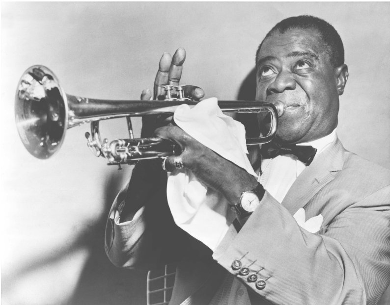
Louis Armstrong était riche grâce à sa trompette

Méditer sur ce que tu n'utilises pas. Pourquoi ne pas le vendre ou le donner ?