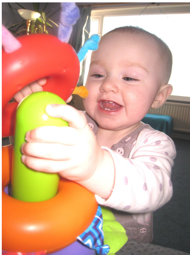
Un enfant en train de jouer